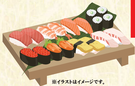
※イラストはイメージです。